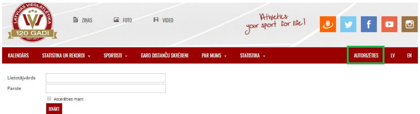
Att. 1 - Autorizācijas lapa

Autorizācija - https://athletics.lv/lv/auth/login