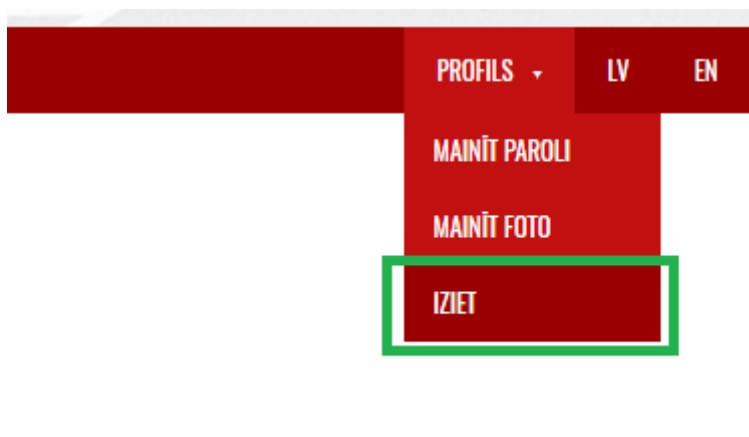
Att. 8 - Iziet no profila

Beidzot darbu sistēmā, izvēlnē jāizvēlas "Profils -> Iziet" (att. 8).